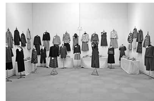
市民学校作品展「大人が素敵に見える服(洋裁)」

主催 高知市教育委員会・公益財団法人高知市文化振興事業団 会場 高知市文化プラザかるぽーと内 中央公民館 期間 平成29年5月16日(火)から週1回 ※科目により開講日と時間が異なりますので、ご注意ください。 ※6回コース「男の料理教室」、10回コース「和紙ちぎり絵」「油絵の基礎」「楽しいくらしの英会話」「陶芸入門」「竹細工入門」「英会話入門」「大人が素敵に見える服(洋裁)」、その他の科目は8回コース 受講料 1科目 6回コース 3,000円 8回コース 4,000円 10回コース 5,000円 ※科目によって材料費等は別途負担。 (各科目の材料費等の欄に太字で金額が明記されている科目は受講料とともに前納。)